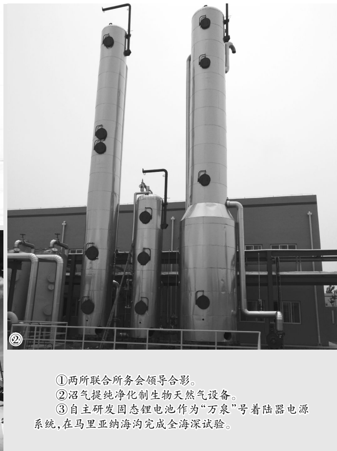
② 沼气提纯净化制生物天然气设备